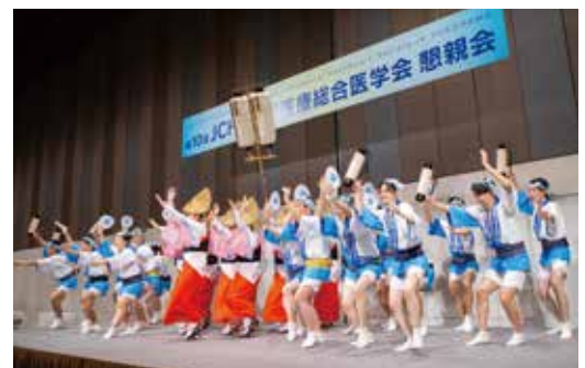
♡ 〇 〴 #余興 #阿波踊り #懇親会