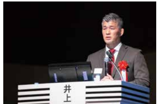
♡ 〇 〴 #井上 #講演