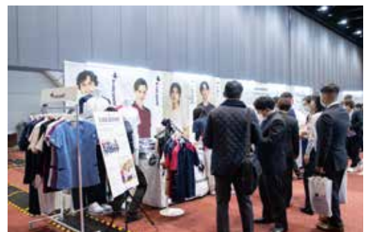
♡ 〇 〴 #展示