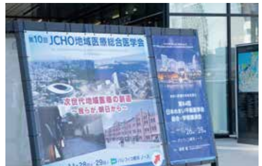
♡ 〇 〴 #会場前