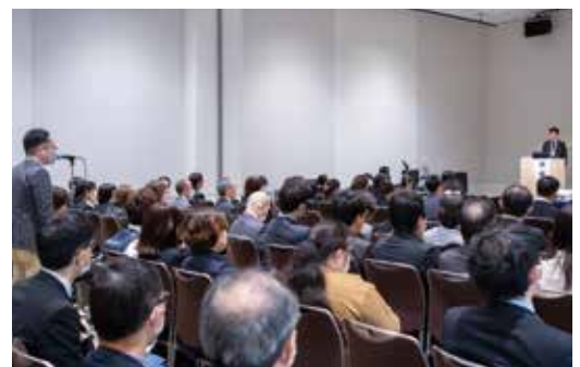
♡ 〇 〴 #雰囲気よし!